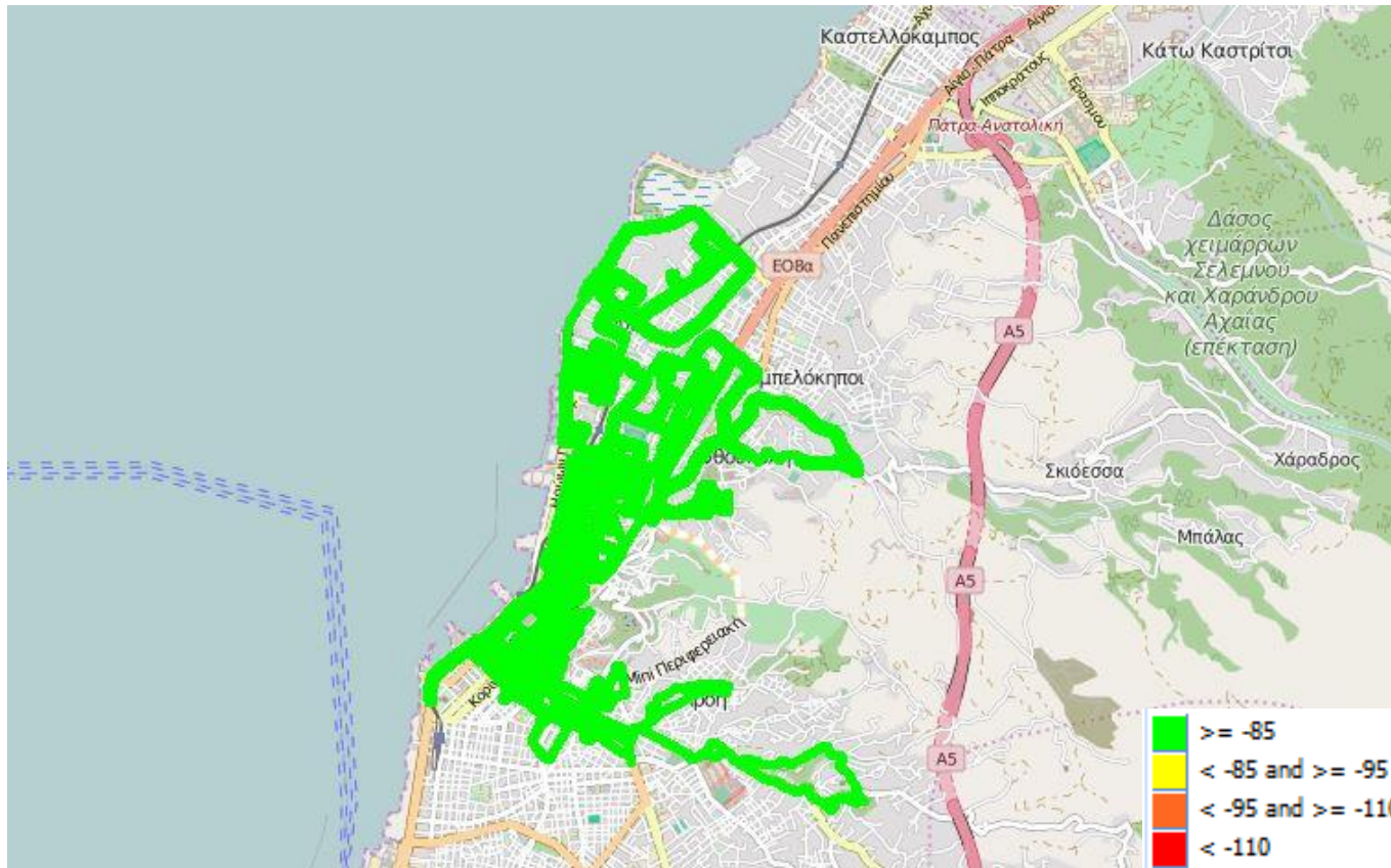
Εικόνα 13-1: Ραδιοκάλυψη WIND – GSM